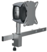
Ref.-Nr. 25065, 25066