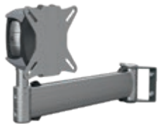
Ref.-Nr. 25018, 25044