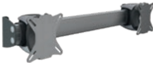
Ref.-Nr. 25005, 25031