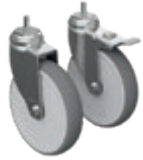
Ref.-Nr. 26076, 26077